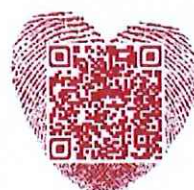
中国国际环保展览会公众号